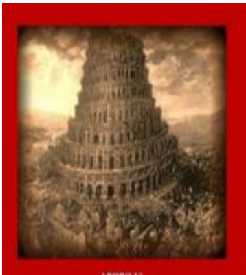
Άρθρο 13: Φοιτητική Ηλεκτρονική Εφημερίδα Εκκλησιαστικού Δικαίου Αρχαιολογική Σύμπραξη